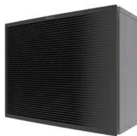
Jednostka zewnętrzna EPRA-D WysxSzerxGłęb.: 1003x1270x533